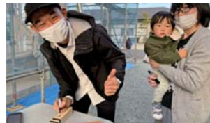
③天候にも恵まれ、ご家族の名前と共に新しい暮らしへの想いや願いを棟札に書き記す。