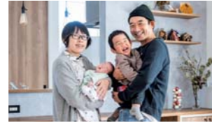
⑥長い月日を経て、ついに完成したマイホーム！ご家族の笑顔から満足度の高さが窺える。