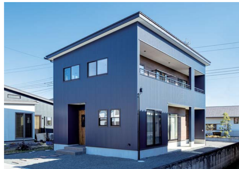
「四角×シンプル×ガルバリウムの外壁」という当初から思い描いたイメージを見事にカタチに。洗濯物がたくさん干せるインナーバルコニーや、軒下はサイクルポートを兼ねるなど実用性も高い。

「実際に建てたお施主さんの住まいを見たい」という方は完成見学会に参加してみよう。およそ2ヶ月に1回ほどの頻度で開催されており、日程については同社のホームページで確認できる。また、併せて過去に手掛けた様々な実例や施主の家づくり体験談も掲載されているため、興味のある方はぜひアクセスを。もちろん電話問い合わせや本誌の巻末ハガキから資料請求すれば、同社から直接イベントの案内を得ることも可能だ。