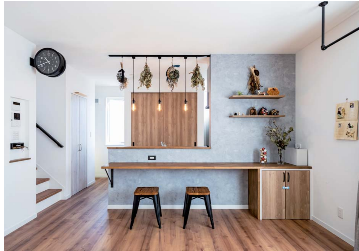
フィラメントのノスタルジックな輝きが見る者の心を癒す裸電球。そしてダクトレールから吊るした奥様手作りのドライフラワーと調和する、モルタルアートをイメージした壁紙。奥様の想いが詰まったキッチン&カウンターダイニングは「ナチュラル・ヴィンテージ」がコンセプト。(この見開き頁の写真はK氏邸)