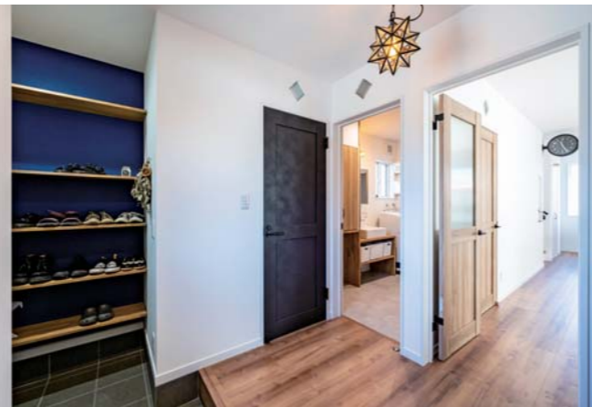
仕事上、衣類が汚れがちなご夫婦のライフスタイルを踏まえ、玄関と洗面脱衣室が直結した「帰宅動線」を実現。壁のガラスブロックは中の灯が漏れるため「誰かが使っている」ことが伝わる。