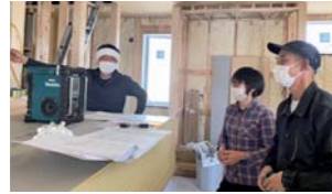
⑤「我が家と思って責任工事」が同社のモットー。様々な造作工事も直接、現場でチェック。