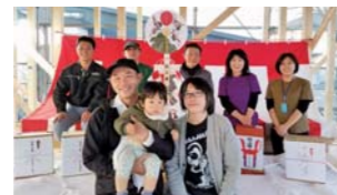
②大吉日に迎えた「上棟式」。無事に工事が進んだことへの感謝と、今後の安全を祈願。