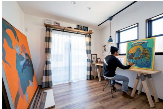
絵を描くのが趣味の、ご主人のアトリエ。キャンバスを持ち運ぶ際の移動距離や、気兼ねなく一人の時間が楽しめるようにと玄関に隣接。将来的に寝室として使うことも考慮した豊富な収納量も特長。