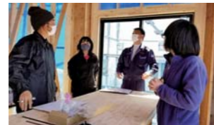
④同社の特長である「現場での入念な打合せ」。この日は電気配線や照明の位置を確認。