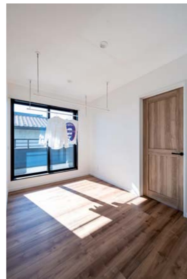
南向きのランドリールームは陽当たり抜群。キッズスペースやセカンドリビングとしての用途も見据えている。

企業DATA 株アーリーホーム 〒376-0121 群馬県桐生市新里町新川1156-5 TEL.0120-775-334 URL https://www.early-home.co.jp/ E-mail otoiawase@early-home.co.jp