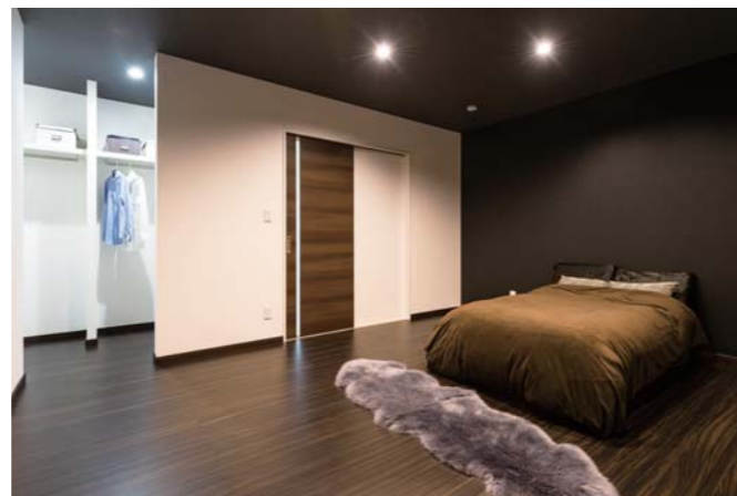
日々の疲れを癒し、上質な眠りを堪能できるよう落ち着いた、シックな雰囲気コーディネートのベッドルーム。たたむ手間を省く、ハンガー中心のウォークインクローゼットも見所だ。