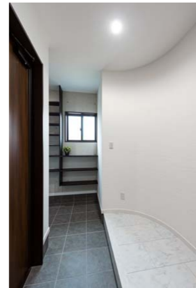
見所は玄関扉の正面に位置した、アールの塗り壁。奥行きのある、隣接の土間に豊富なシューズクロークを完備。