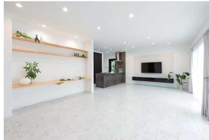
白を基調としたモノトーンな空間に、飾り棚を兼ねたスタディーコーナーに使用した「木の優しさ」が溶け込む。また、キッチンには調理家電や食器類がすっきり隠せる背面収納を完備している。