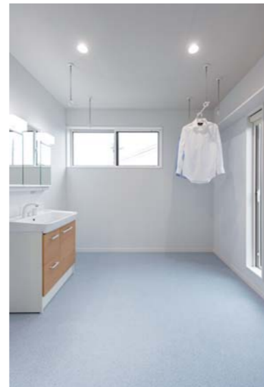
充分な量の洗濯物が干せる、ランドリールームを兼ねた洗面脱衣室。