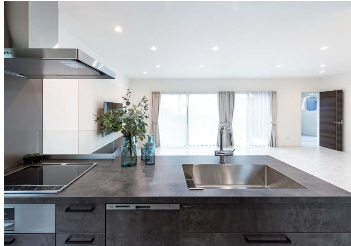
生活感のない、いつでもすっきりとした美しさが保てるよう「シンプル&ラグジュアリー」をコンセプトに掲げる住まい。特にマットな質感が魅力の大理石調フローリングに対して、対照的なベントグレーのキッチン「GRAFTEKT(グラフィテクト)」が、邸内を彩るインテリアのように映えるだろう。(この見開き頁の写真はS氏邸)