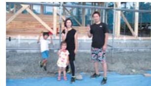
⑤少しずつカタチになっていく家の前で、ご家族の笑顔が、満足度の高さを物語る。