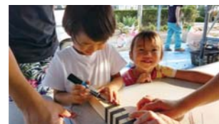
③棟札に、ご自身の名前と共に新しい住まいへの想いを書き記す。上手に書けたかな？