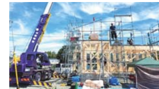
④「我が家と思って責任工事」がモットー。大勢の職人が、一丸となって取り組んでいる。