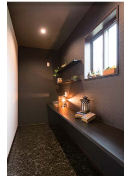
LDKとは対極のデザインで仕上げた、約3帖ほどの書斎。パソコンや読書など、また違った気分でご過ごせるだろう。