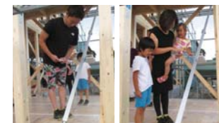
②ご家族が大工と共に、建築中の邸内の四方に酒・塩・米を撒く「お清め」からスタート。