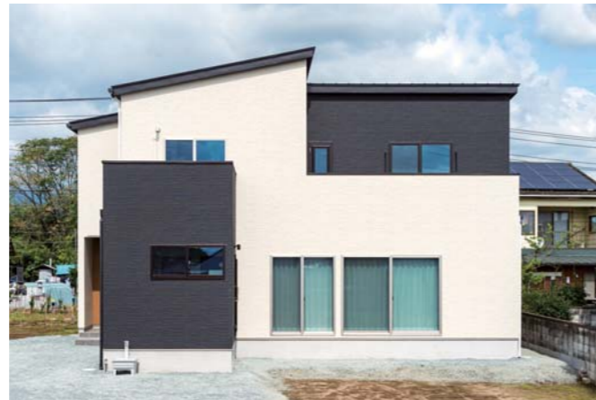
凹凸や片屋根による立体感を持たせた外観は、白と黒の2色をバランス良く配したツートンカラー。2か所に設けられたバルコニーの存在感を上手に消している点にも注目してほしい。