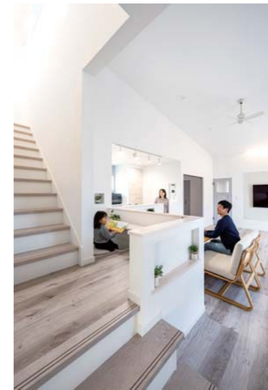
お子さんの宿題やご主人のパソコンを目的としたスタディーコーナー。TV周りの壁はこだわりのエコカラット。