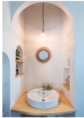
アールを描いた下がり壁と天井、ニッチ、玄関に掛けられた、可愛いセカンドシンク。