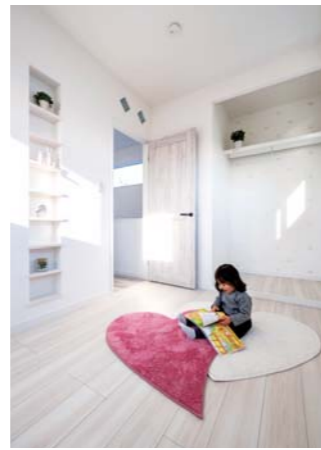
2階は子ども部屋だけ。ご夫婦の暮らしは1階で全て完結する、老後まで見据えた間取り。