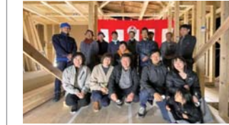
③大安吉日を迎えた「上棟式」。ここまで無事に工事が進んだことを皆で祝い、感謝を込める。