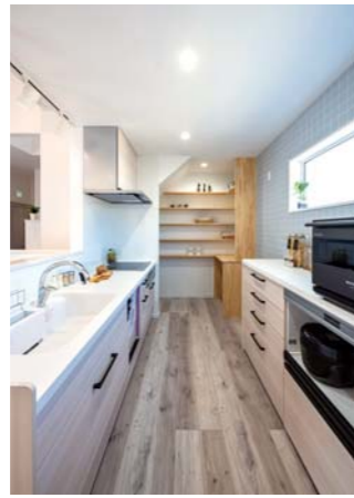
階段下を活用したバントリーの棚も、要望に応じて造作で対応。グレーの壁紙がアクセント。