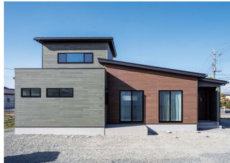
室内の天井を高く設計できるように一部に「平屋」を組み合わせた外観。茶と緑のツートンに、差し色としてサッシュで黒をミックス。「思っていた以上にカッコ良く仕上がりました」とご主人も満足そう。