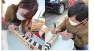
④ご主人、奥様それぞれが棟札に名前と共に新しい住まい、暮らしへの想いや願いを書き記す。