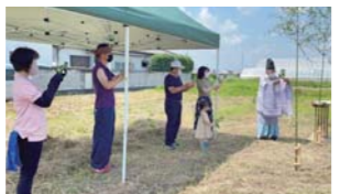
②晴天に恵まれ、絶好の「地鎮祭」日和。ご家族とスタッフで工事の安全と今後の繁栄を祈願。