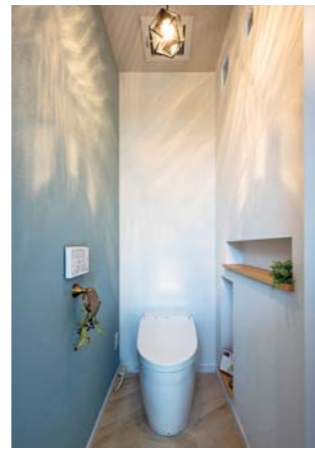
ペンダントライトの鮮やかな陰影が美しいトイレ。床は奥様お気に入りのヘリンボーン柄。