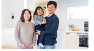
⑥長い月日を経て、ついに完成したマイホーム!ご家族の笑顔から満足度の高さが窺える。