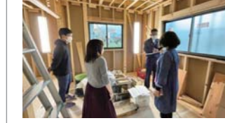
⑤同社の特長である「現場での入念な打合せ」。この日は電気配線や照明の位置を確認。