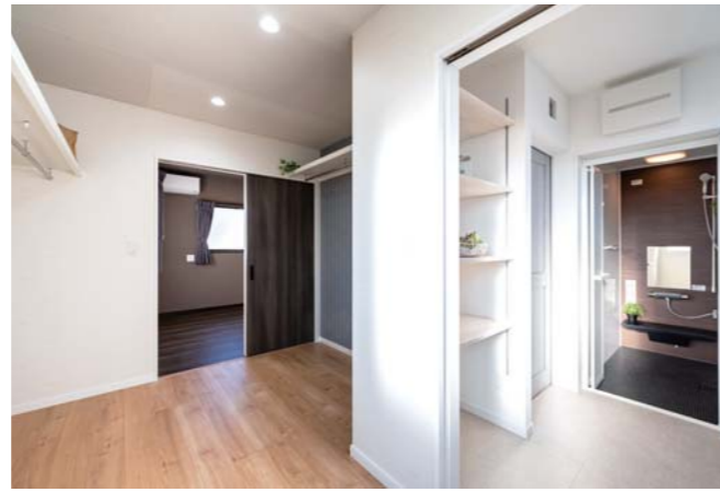
日頃の家事・育児、そして仕事との両立を「いかにラクに実現するか」を目指した動線。脱衣室からランドリールーム、部屋のような広さのウォークスルークローゼットを経て寝室へと続く回遊式。